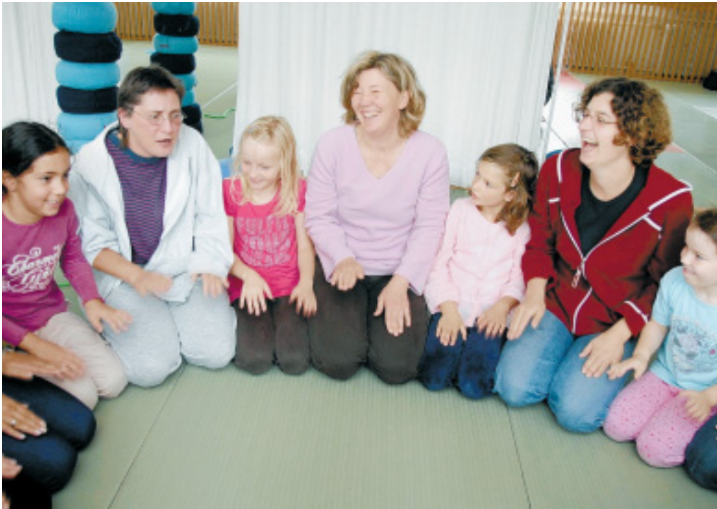
Spaß haben und Vertrauen stärken: In den zweitägigen Kursen für Mütter und Töchter im „Bellzett“ in Bielefeld wird am Selbstbewusstsein und am Auftreten gearbeitet.